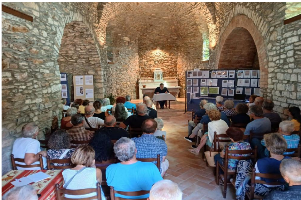
Le 20 septembre l'église était pleine, il a fallu rajouter des chaises !!!!!