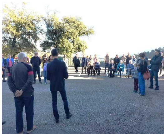
Le moment de l'hommage aux disparus

Nous constatons avec satisfaction que chaque année, le nombre d'habitants qui viennent assister à la commémoration de la fin de la 1ère guerre mondiale augmente. En effet cette année plus de cinquante personnes étaient présentes soit presque la moitié de la population de la commune ! Cela signifie que les jeunes générations n'oublient pas les 10 jeunes hommes natifs de Soustelle qui ont perdu leur vie pour défendre leur pays bien loin de leur famille, de leur mas et de leurs Cévennes.