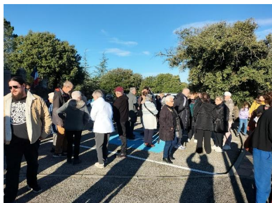
Cette année nous étions plus de 50 présents