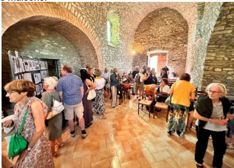
les amateurs d'histoire ont pu découvrir l'intérieur de ce monument historique bâti au XII ème siècle