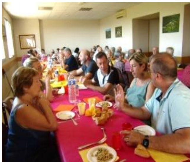
UNE PARTIE DES CONVIVES