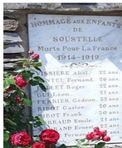
Les jeunes ont participé à cette commémoration

N'oublions pas les 10 « poilus » de notre commune qui ont perdu la vie durant ces 4 années de guerre