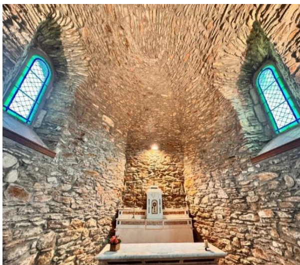
Une photo originale du chœur de l'église

La date de la pose de la première pierre, personne ne la connaît vraiment, toutefois la consultation des archives nous apprend que le nom de la paroisse de « Sostella » ancien nom de Soustelle apparaît dès le XII ème siècle. Dans le document extrait du dictionnaire du Gard il est précisé que le nom de « Sostella » nom latin de Soustelle, figurait déjà en 1277 dans un document conservé aux archives de Nîmes.