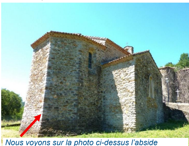
Nous voyons sur la photo ci-dessus l'abside pentagonale (5côtés)