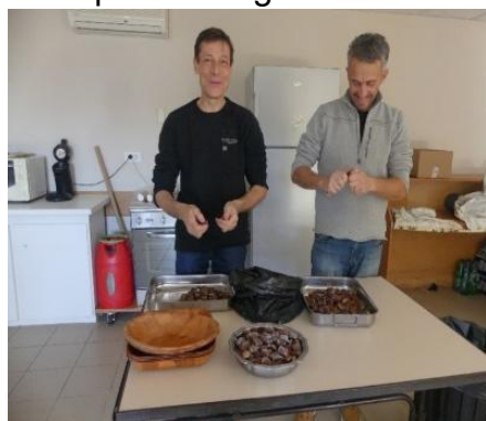
1) on taille les châtaignes

Cette belle tradition que nous avons de partager une castagnade, le fruit de saison par excellence, se déroule comme chaque année en 3 opérations. Sans oublier les jus de fruit et le cidre pour faire glisser tout cela !!!