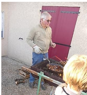
2) on cuit les châtaignes