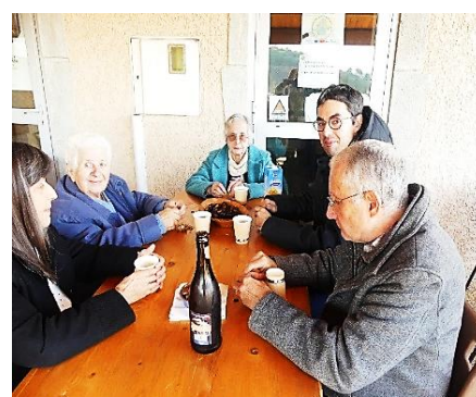
3) on mange les Châtaignes !!