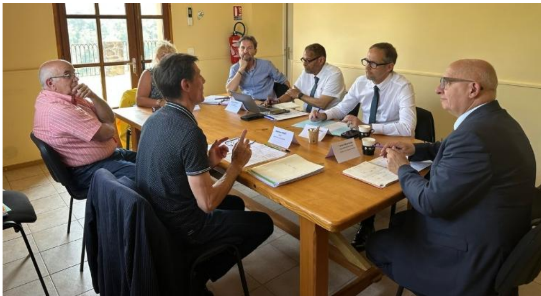
Des échanges entre les élus, le Préfet, le Sous-préfet et les Conseillers Départementaux pendant plus de 2h30.

Cette longue visite, du plus important représentant de l'Etat dans le département du Gard, restera comme un grand évènement pour notre petite commune. Cette rencontre fut l'occasion de faire le bilan sur l'ensemble des chantiers, ceux qui ont été réalisés. Les échanges ont été courtois mais cela n'a pas empêché les élus d'évoquer aussi les dossiers qui « n'avancent pas assez vite » :