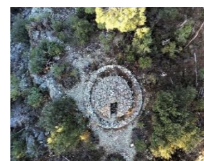
le "Ron traoucat" vue d'un drone

En 2022, pour la première fois, Soustelle a participé aux journées Européennes du patrimoine. Le Groupe Alésien de Recherche Archéologiques (GARA) a fait découvrir à une vingtaine de visiteurs les sites du « Ron traoucat » et de Peyraube ainsi qu'une exposition sur notre patrimoine. Nous avons entamé une action pour revaloriser les forêts communales. Pour cela un dossier est en cours auprès de l'ONF pour établir un document de gestion durable de la forêt communale. Dans un second temps nous pourrions réfléchir à un chantier de mise en valeur de la forêt et prétendre aux aides correspondantes délivrées par Alès Agglomération.