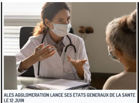
ALES AGGLOMERATION LANCE SES ETATS GENERAUX DE LA SANTE LE 12 JUIN