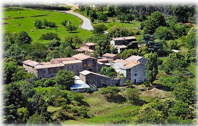
Une très belle vue du hameau du sollier

Afin de mettre en valeur les paysages de notre commune et de renouveler la décoration de la salle polyvalente, le conseil municipal a décidé de commander des photos aériennes prises par un photographe professionnel mandaté par Alès agglomération il y a quelques années.