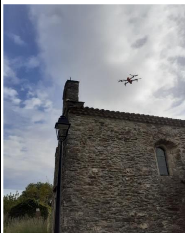
Ci-dessus le drone de l'entreprise est déjà venu faire des photos