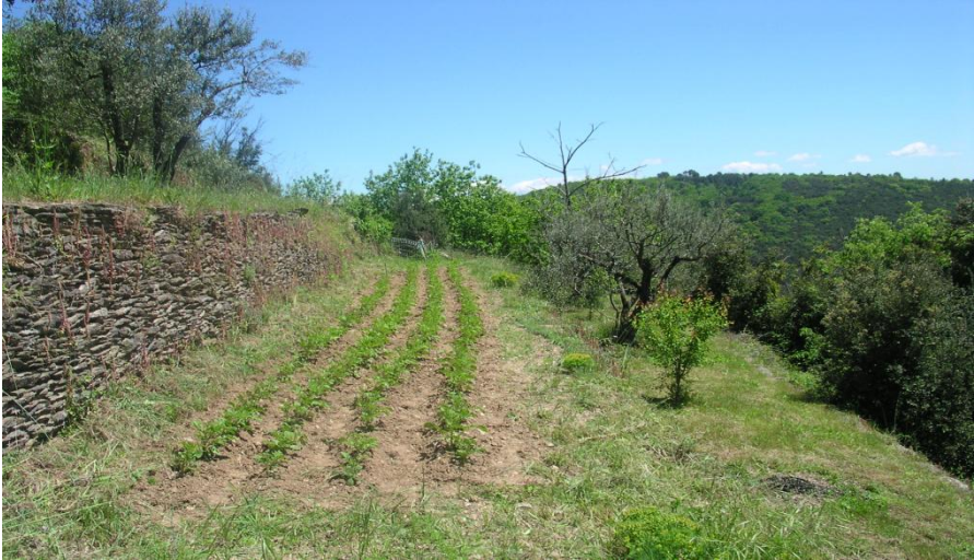
Vue des « faïsses » (bancels) à Arbousse